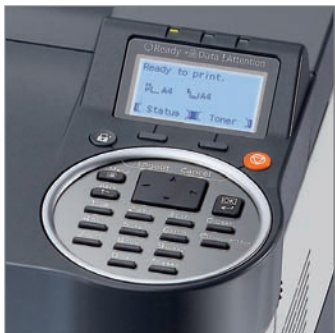
Display a 5 linee