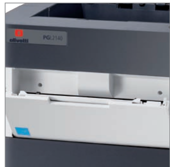
By pass da 100 fogli (60-220g/m 2 )

Inoltre per rispondere alle nuove tendenze del mercato e per migliorare l'operatività delle nuove stampanti monocromatiche con l' opzione wireless IB-51 si offre la possibilità di stampare in piena mobilità da tablet o smartphone.