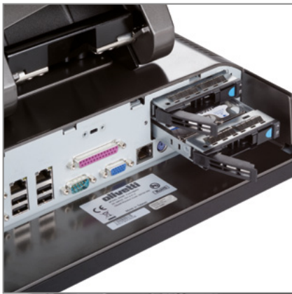
SUPPORTA 2 GIGA LAN, 2 HARD DISK RIMOVIBILI CON FUNZIONE RAID 0,1