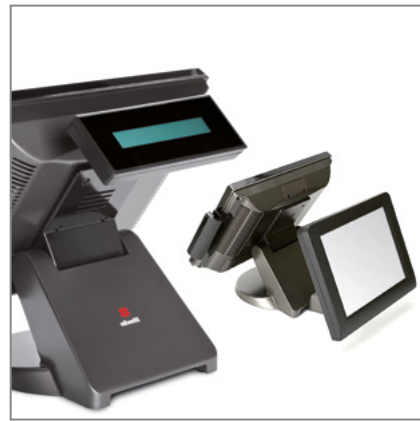
DISPLAY CLIENTE O SECONDO DISPLAY LCD (opzionali)