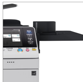
Pinzatrice offline opzionale