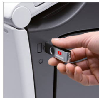
Stampa e scansione diretta con chiavetta USB. Stampa diretta di formati Microsoft Office (OOXML)