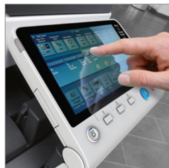
Pannello a colori da 7" multi-touch con tastierino 10 tasti (opzionale)

IMPIEGO DI MATERIALI RICICLATI PER UN IMPATTO AMBIENTALE CONTENUTO