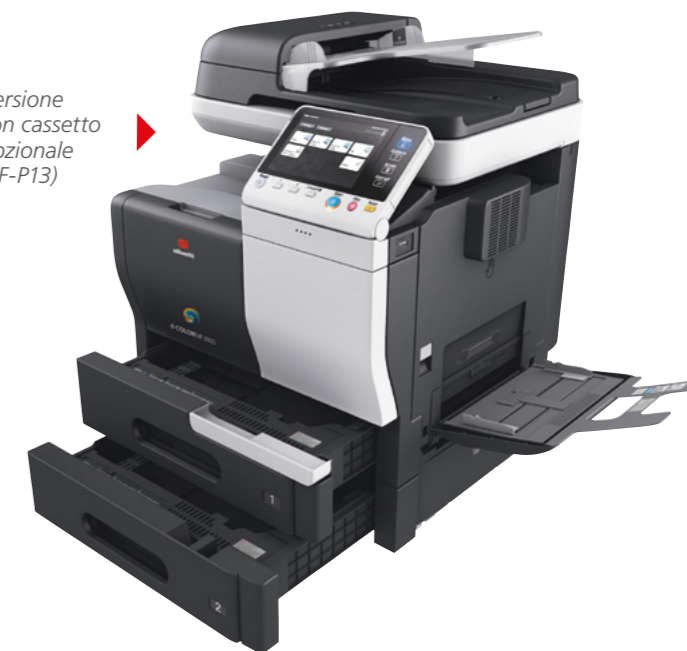
Versione con cassetto opzionale (PF-P13)

La capacità standard di 650 fogli può essere aumentata ad un massimo di 1.650 aggiungendo fino a due cassette opzionali da 500 fogli. La produttività in ufficio è ulteriormente migliorabile installando una pinzatrice offline opzionale.