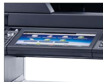
Display touch da 7" con inclinazione fino a 20°