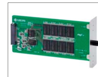
Gestione documentale facilitata con memoria opzionale da 32 o 128 GB