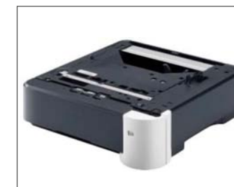
Grande capacità di carico carta fino a 2.600 fogli